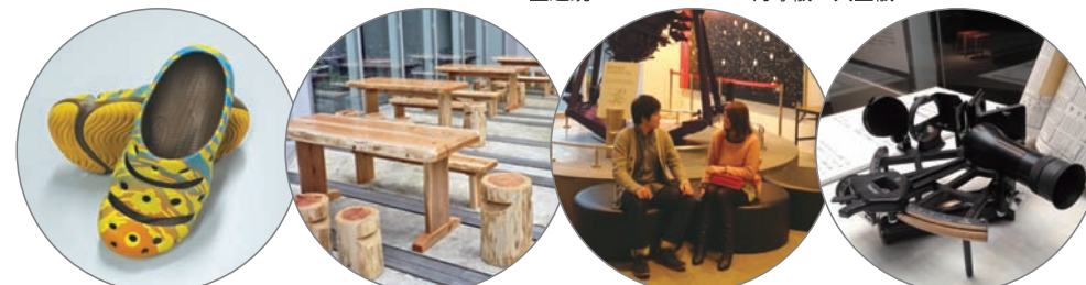
スタッフ着用シューズ 惑星広場デッキチェア オープンスペースソファーカーパー 六分儀