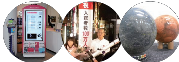
デジタルサイネージ 望遠鏡 月球儀・火星儀