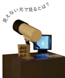
見えない光で見るとは?